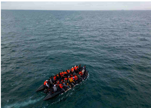
Des migrants traversant la Manche, le 6 août 2024.

Depuis son arrivée au pouvoir en juillet 2024, le Premier ministre britannique Keir Starmer a promis de renforcer la lutte contre les réseaux de passeurs, qu'il entend traiter "comme des terroristes".