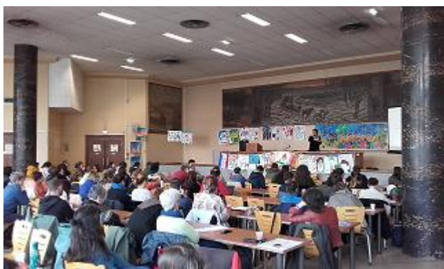
Le grand groupe à la Bourse du travail

Vous pouvez retrouver des informations sur la protection de l'enfance dans une fiche pratique éditée par Romeurope en 2020 : " La protection de l'enfance à l'épreuve des bidonvilles ".